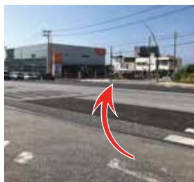
2 LIXIL さんのショールームがある十字路 (真志喜南) を右手に曲がります。