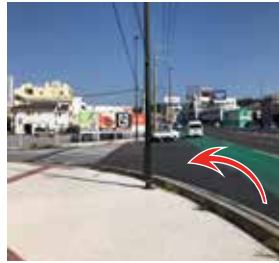
3 モスバーガーさんと丸亀製麺さんの間の道を左手に曲がります。