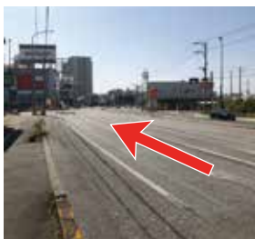
1 国道 58 号線を進むと、右手に LIXIL さんの看板が見えてきます。