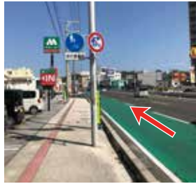
2 左手にモスバーガーさんが目印の丁字路が見えてきます。