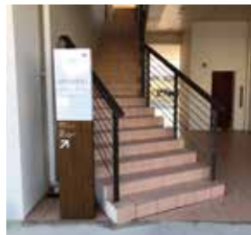
9 こちらの階段又は右奥のエレベーターで 2 階までお越しください。