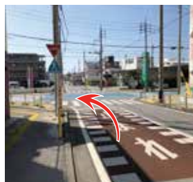
6 ジャーダンさんを過ぎてすぐの十字路を左手に曲がります。