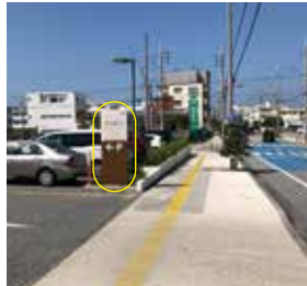
5 サンゲツ沖縄ショールームの看板が見えてきます。