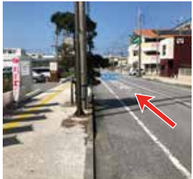
4 そのまま道なりに 200mほど進みます。