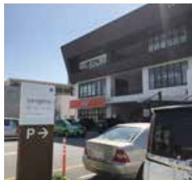
8 こちらの建物の 2 階がショールームとなっています。