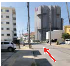
4 400mほど道なりに直進。