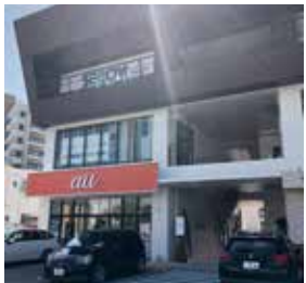
7 こちらの建物の 2 階がショールームとなっています。