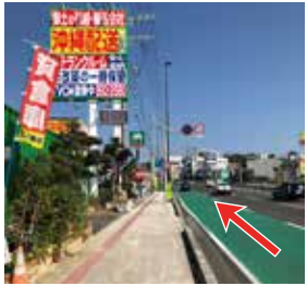
1 国道 58 号線を進みます。