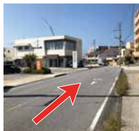
3 そのまま道なりに直進します。