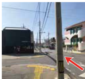
5 左手にスコーン専門店 ジャーダンさんが見えてきます。