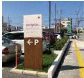
6 看板の手前で、左手に曲がります。