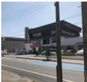
7 右手に 3 階建ての建物が見えてきます。