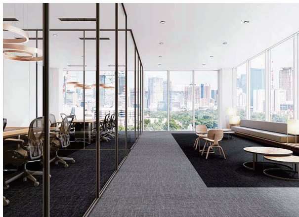
オフィス施工例：NT-70601・70603・71303