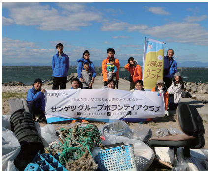
社員ボランティア活動で、漁網やプラスチックなど大量のごみを回収

10月23日(土)、「NT double eco」発売と連動した社会貢献活動として、愛知県常滑市西之口海岸で、日本自然保護協会の「砂浜ムーブメント」と連携した清掃活動を実施しました。