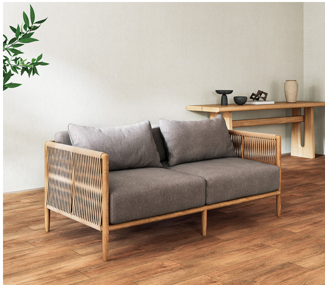
再生ナイロン糸「エコニール®」を使用 イス：UP5631

漁網やカーペット廃材などを再利用した 100% リサイクル糸「エコニール®」を採用した「ナイスト」や、生産工程での水使用量や CO 2 排出量が少ないため環境にやさしく、色落ちしにくく長く使える原着ポリエステル糸「モコフィーロ」を採用した「トランペ」、再生糸を 100%使用した「ムーモル」といった低環境負荷商品を、前見本帳よりも増点しています。環境に配慮しながら、一般品と同様の価格設定とすることで、より使いやすい商品としています。