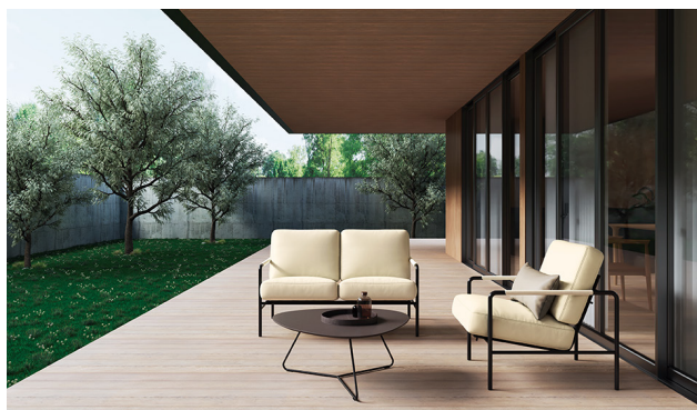
アウトドア家具にもおすすめの「NP アビデ」 イス：UP5211 クッション：UP5213