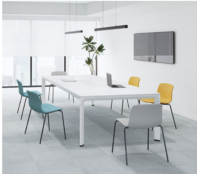
再生糸を100%使用した「ムーモル」ニット生地で優しい色展開 イス：UP5647、UP5644、UP5643