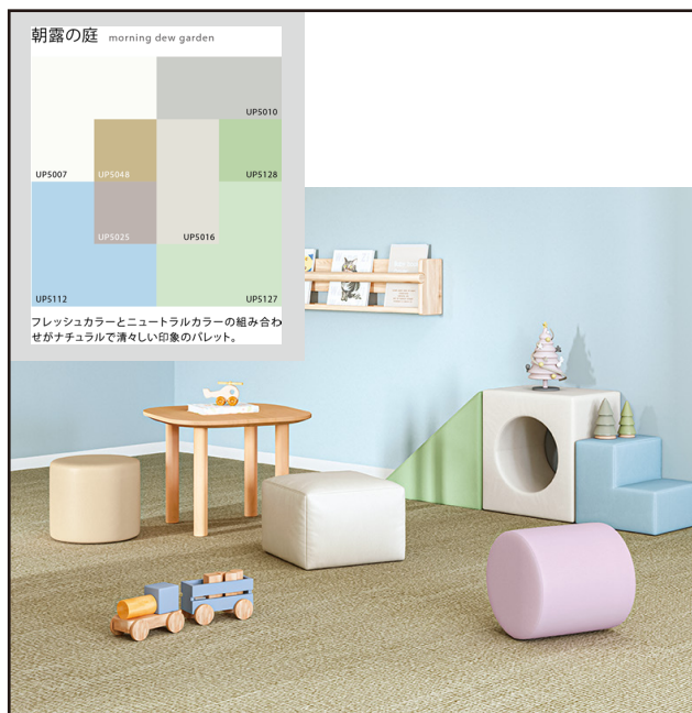
カラースキーム「朝露の庭」をイメージして空間全体をコーディネート/UP5040、UP5016、UP5103、UP5128、UP5112