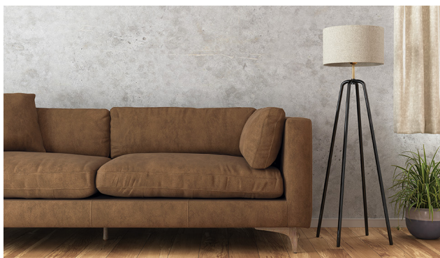
アクアクリンの新商品「ピソン AC」 イス：UP5591

椅子やソファといった日常的に使う家具は、汚れの落としやすさや衛生面での機能も重要です。メンテナンス性の高い機能性商品「アクアクリン」では、普段の生活で付きやすい飲食物、皮脂汚れや泥、ペットのフンといった汚れに至るまで、水だけで簡単に落とすことができます。「アクアクリン」シリーズは、2016年の発売以降、多くのご評価をいただいております。同見本帳では10柄100点と柄・点数ともに拡充しました。さらに、抗ウイルス機能を持つ新商品を2柄掲載し、より衛生的で安心・安全な空間づくりを提案します。また、近年のアウトドアブームやさまざまなイベントの再開・活性化を受け、アウトドア用の家具やキャンピングカーのシート、スタジアムの観客席等に最適な耐候性商品も増点しました。