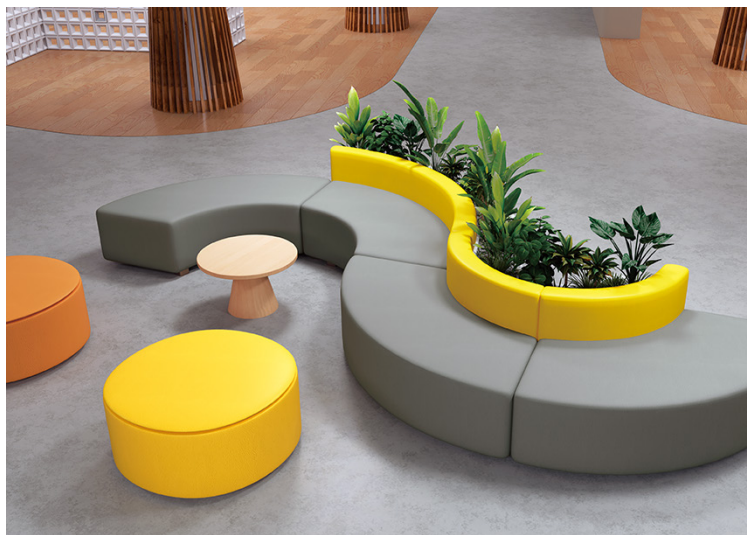
150色のカラーバリエーションを誇る新商品：カラーレザー UP5084、UP5076、UP5020、UP5075

椅子生地は、椅子やソファ等家具の仕上げとして、住宅から商業施設・オフィス等の非住宅分野まで幅広く使用できる商品です。人気の高い軽やかでシンプルなインテリアスタイルに対応するため、同見本帳では、さまざまな空間でコーディネートしやすくコストパフォーマンスに優れた無地調の商品を大幅に増点しました。また、日常の汚れを落としやすい機能性商品や、屋外での使用が可能な商品も拡充しました。多様なコーディネートで空間にさまざまなストーリーをもたらす、148柄1,130点のラインアップです。