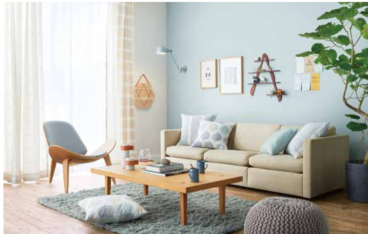
床色「ミディアム」におすすめのインテリアスタイル「Natural Comfort」 施工例：壁／77-2051・アクセント／77-2083