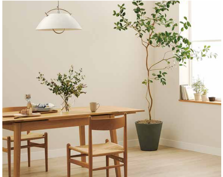
床色「ライト」におすすめのインテリアスタイル「Simple Modern」 施工例：77-2018