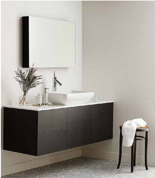
お部屋の用途に合わせた機能性アイテムを紹介 施工例：77-2055（フィルム汚れ防止壁紙）