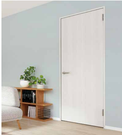
既存の室内ドアや三方枠に施工することで、お手軽にリフォームが可能 施工例：リアテック TC4164