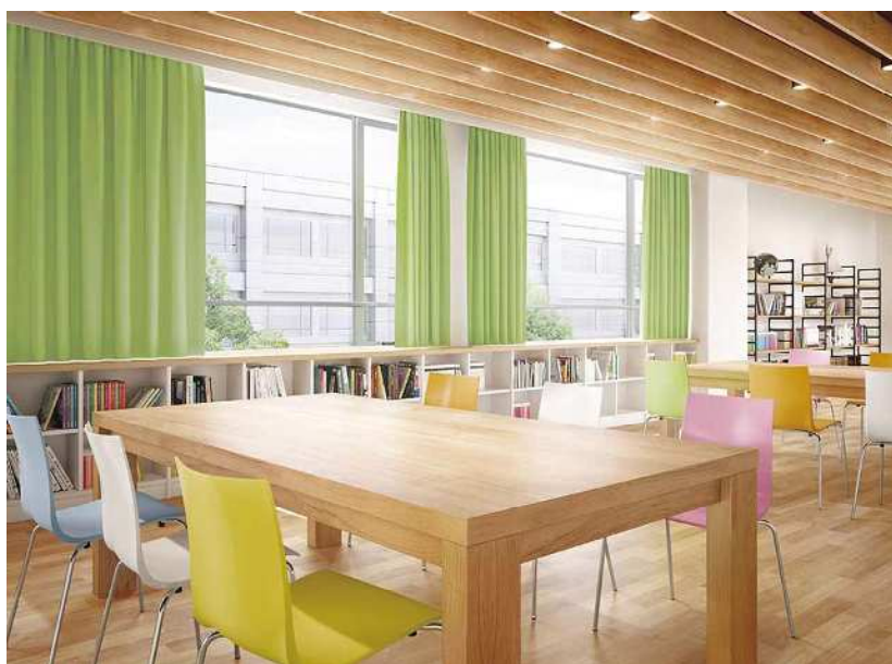
抗ウイルス加工・制菌加工カーテンを使用した空間 PK9233-2 施工例