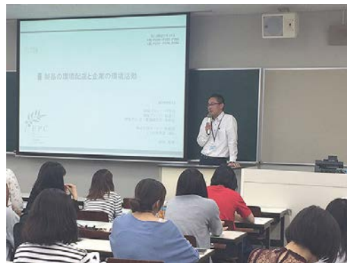
社員による環境講座（東京家政大学）

持続可能な社会における、企業の環境経営を促進する人材「環境プランナー」の育成を目的として設立された一般社団法人環境プランニング学会は、企業や団体および地域において環境配慮活動を促進しています。当社も、その趣旨に賛同し、環境プランニング学会と協働し、東海地区の環境配慮活動を促進できる人材の育成および活動のフィールドづくりを行っています。