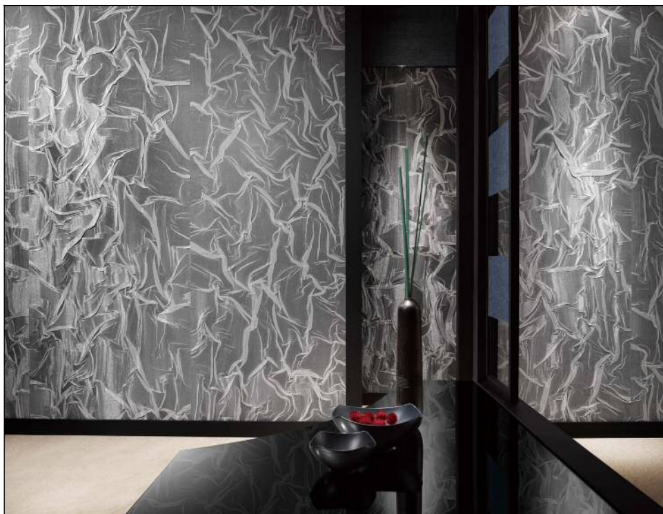
SGB-102 施工例 モダンな空間を演出する、創作織物