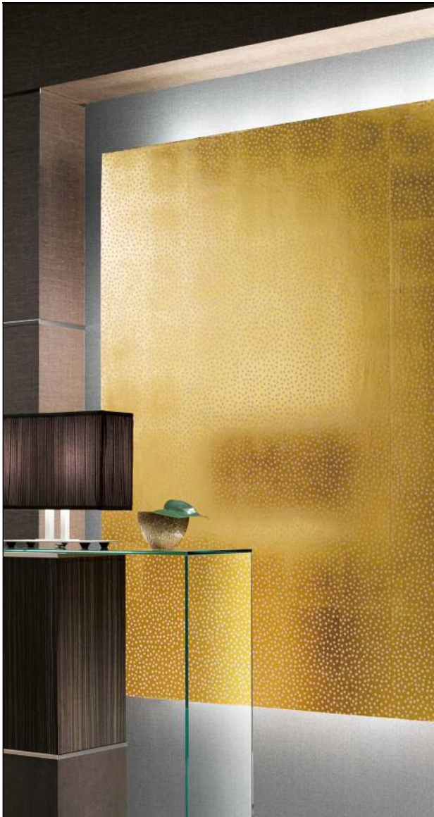
SGB-110 mist 施工例 「サンゲツ壁紙デザインアワード 2017」大賞受賞作品 山田茂作