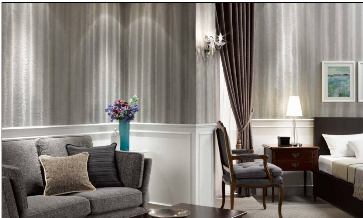
SGB-704 施工例 新素材壁紙「ファー」で、個性引き立つインテリアシーンを表現