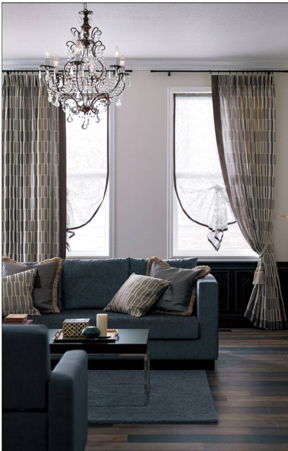
クラシカルな洋間にモダンなカーテンを組み合わせた華やかなコーディネート ドレープカーテン SC3010/シアーカーテン SC3703 の施工例