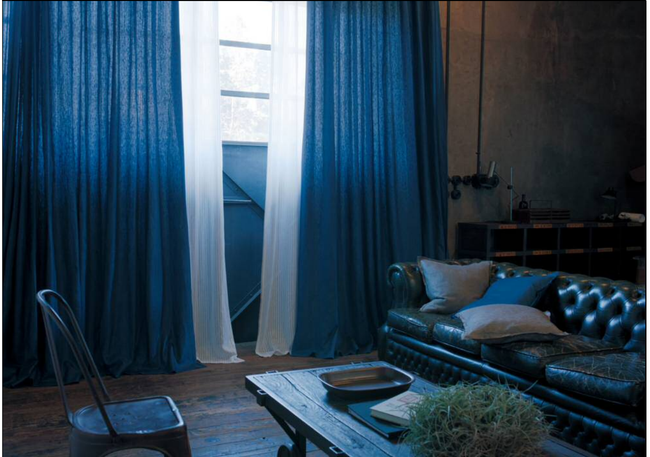
天然素材ならではの風合いと優しく透過する光で、やわらかい空間を演出 ドレープカーテン SC3224/シアーカーテン SC3230 の施工例