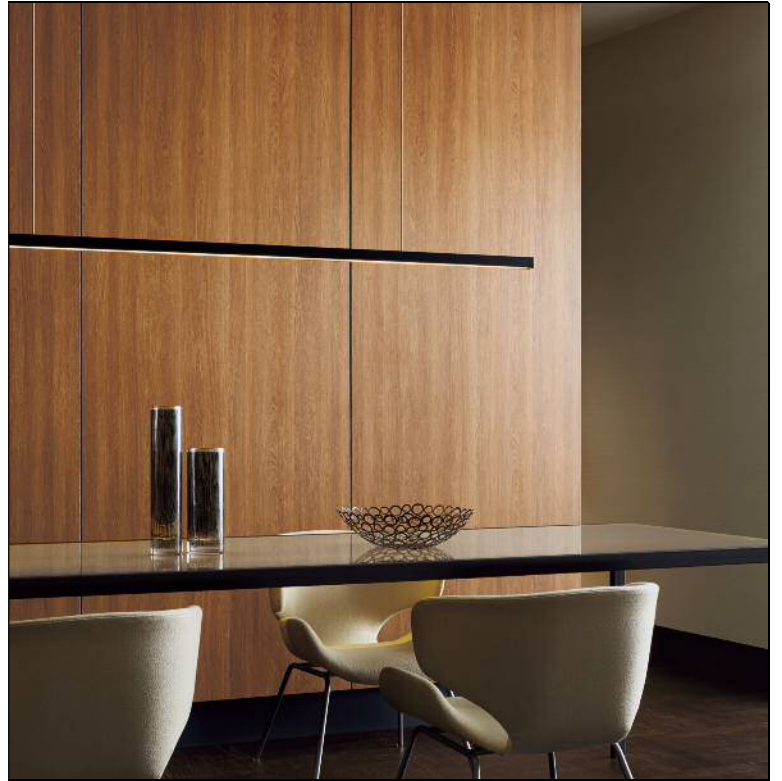
木肌の凹凸を緻密に表現した 「REAL WOOD EXTRA」 RW-4004（オーク）の施工例（左右とも）