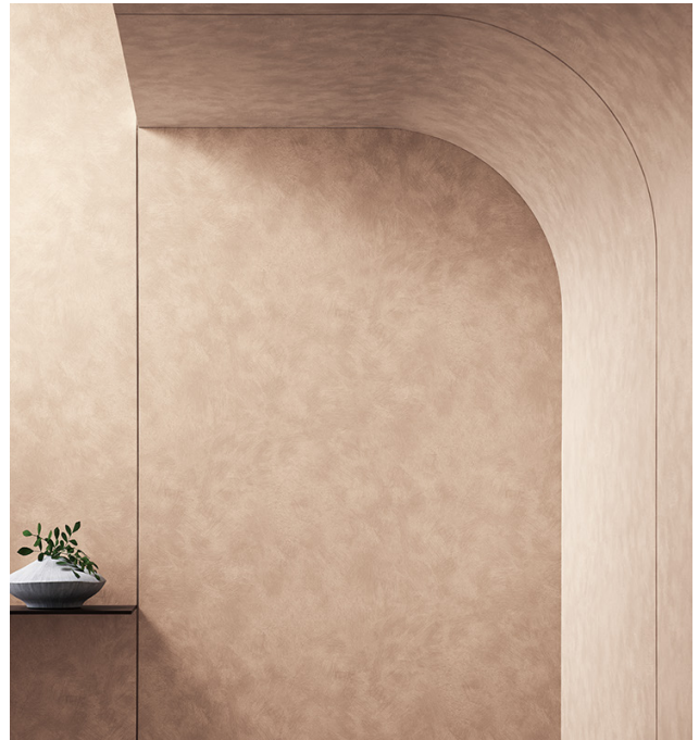
パールスタック : TU-5662 リアテックだからこそできる曲面への施工