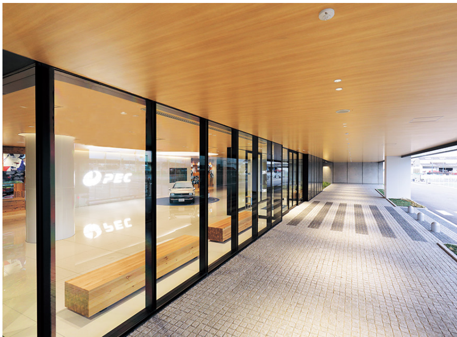
物件名：PECホールディングス株式会社 (事業会社：太平洋精工株式会社) 設計：株式会社 山下設計

また、同見本帳には、さまざまな空間とリアテックが調和した施工例写真を豊富に掲載し、より美しく見えるインテリア・エクステリアのトータルデザインを意識しました。木目柄 × コンクリートといった、さまざまなマテリアルをミックスしたイメージや、陰影による柄の見え方も意識したイメージを掲載しました。