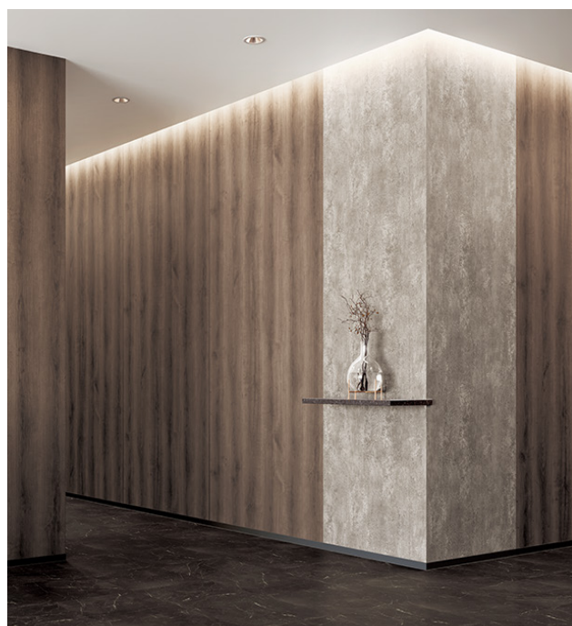
壁：リアルウッド RW-5412・コンクリート TN-5318 木目柄とコンクリート柄のマテリアルミックスの組み合わせ