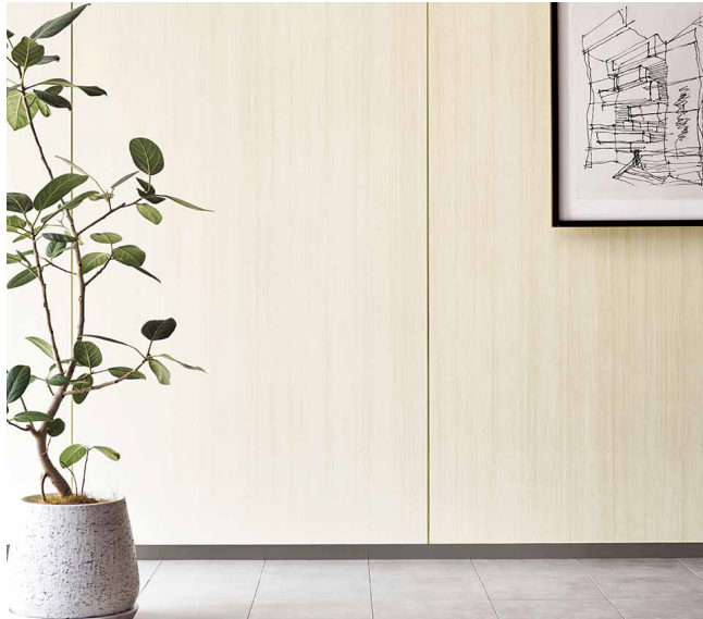
ベーシックウッド : BC-5495

「ベーシックウッド」は、リーズナブルな価格帯を実現したコストパフォーマンスに優れた木目シリーズです。ウォルナットやオークといったベーシックな使いやすい木種で、トレンドのホワイト・アッシュ系の明るい色から、定番のナチュラル・ダーク系の色まで豊富なバリエーションを展開しています。前回の見本帳から全点継続・価格維持とし、引き続き安心してご使用いただけます。