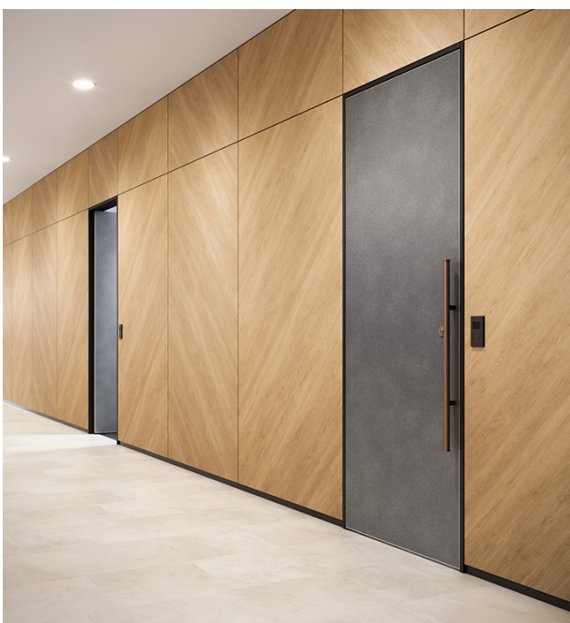
ツヤを抑えた「マットウッド」シリーズ 【壁】RW-5632・RW-5370 / 【扉】TN-5313