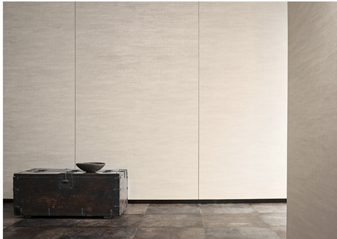
人気シリーズ「自然の輪郭」新商品：Kazaoto TX-5603

リアテックは、平面はもちろん曲面への施工が可能のため、壁面や柱のほか、建具や家具にも幅広く使用できる商品です。不燃仕上げを求められるオフィスや商業・宿泊施設といった各種施設のほか、近年では手軽にリフォームができる内装材として賃貸・戸建て住宅での需要も高まっています。こうしたニーズを受け、同見本帳では、トレンドや市場の開発要望を取り入れ、木種・柄・色・仕上りの質感にこだわった871点を収録しました。