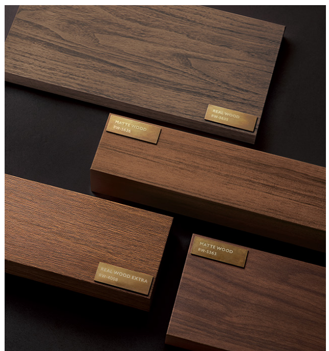
エンボス加工や印刷製法にこだわった「リアルウッド」シリーズ (上から) RW-5635・RW-5626・RW-4008・RW-5363