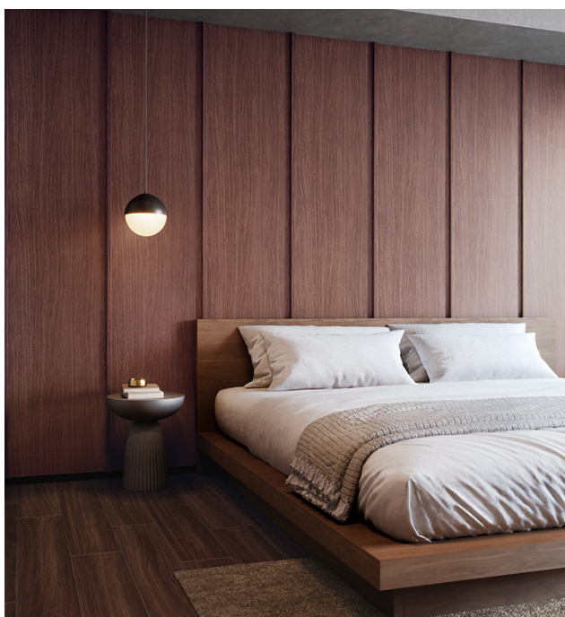
壁：リアルウッド RW-5648 床：フロアタイル WD-2067

木目TCシリーズと、高耐候リアテックの同柄商品で、より中と外の連動性を高めることができる