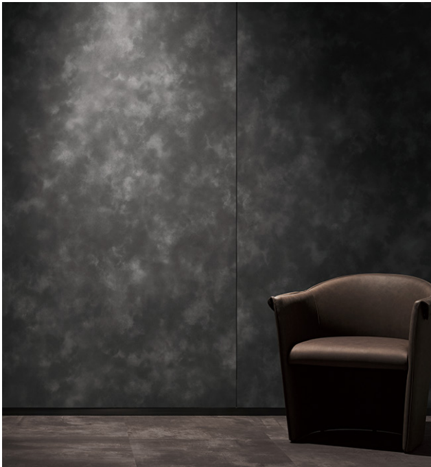
「自然の輪郭」Ukigumo : TX-5610 流れゆく雲が、静謐な時の移ろいを感じさせるデザイン

同見本帳でシリーズ 3 作目となる「自然の輪郭」は、さまざまな建築空間のコンセプトにマッチし、自然のエッセンスを取り入れることができる抽象柄の人気シリーズです。長い時の中で繰り返し生みだされる自然の造形や瞬間的に現れる現象から着想を得て、同見本帳では「Kazaoto (風音)」「Ukigumo (浮雲)」「Shigure (時雨)」「Awayuki (淡雪)」の 4 柄 11 点を新たに追加しました。また、トレンドであるインダストリアルな空間に映える、コンクリートや錆、石などの質感を繊細に表現したマテリアル柄の開発にも注力しました。木目柄においては、マットな質感が特長の「マットウッド」シリーズにおいて、ウォルナットやオークといった使いやすい木種・カラーを中心に拡充したほか、マンゴーやユーカリといったトレンド感のある木種も追加し、53 点から 73 点へと増点しました。さらに、自然な木の表情を追求した「リアルウッド」シリーズでは、新たな特殊印刷製法を取り入れた、本物の木材と見紛うほどのクオリティの新柄を追加しました。