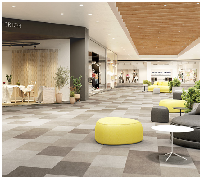
アシュート WF : KT-2017・2018・2019 高い防汚機能があるため、商業施設などにもおすすめ