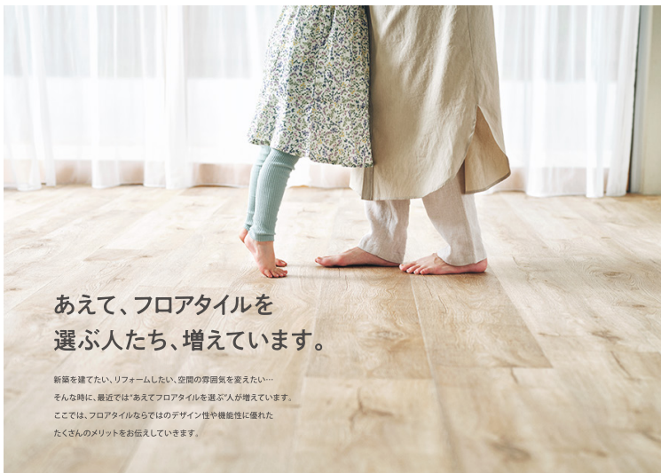
よりリアルな質感を表現した同調エンボスの新商品：ナッシュビルオーク WD-2144

フロアタイルは、豊富なデザインバリエーションや手軽なメンテナンス性、コストパフォーマンスに優れた床材であり、各種施設のみならず、近年は賃貸住宅や戸建てリフォームでの需要も高まっています。また、インテリアに高い感度を持つエンドユーザーが増えている中で、本物さながらのリアルな質感を表現できるアイテムとしての人気も上昇しています。こうしたニーズを受け、同見本帳では、商業施設やオフィスなどのトレンドを取り入れた木目・石目デザインに加え、リビングや寝室など住宅空間全体にもおすすめできる150柄434点を収録し、フロアタイルでつくる心地の良い暮らしや空間を提案します。