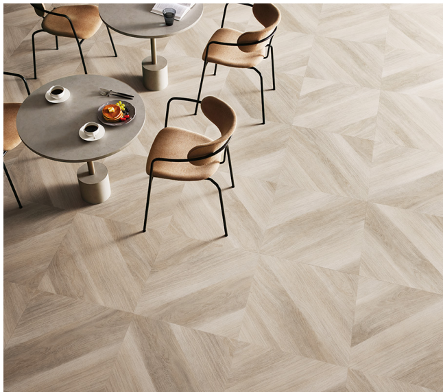
スプレッドパーケット : WD-2115 タイルの貼る方向を変えることで、異なるデザインパターンを楽しむ

商業施設などの非住宅向けのデザインは、市場のニーズやトレンドの分析を行ったうえで、ベース材として使いやすい色柄、そしてビジュアルとして映えるような遊び心がありながら、家具や壁面などの素材とも調和しやすい商品を拡充しました。異なるサイズや貼る方向などの組み合わせで、空間の個性を演出できます。また、ワックスフリー機能付きの新商品「キラリタ」を開発し、人気の木目 4 柄、石目 6 柄で展開しました。高い防汚機能によりメンテナンスコストを削減することに加え、環境負荷の低減に貢献します。