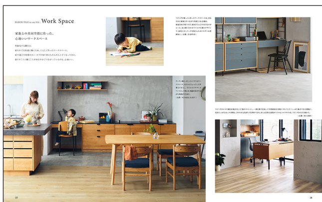
FLOOR TILE in my life : Work Spaceページ インテリア雑誌のように、実際の暮らしを想定した空間を提案

同見本帳付属の冊子 “Lovin’ my life” は、フロアタイルがある暮らしや、心地良く暮らすためのアイデアを紹介する、ライフスタイル提案冊子です。サンゲツが考える「これからの暮らし」と、フロアタイルを選ぶお客様と床材の接点として、暮らしのヒントや、床材を身近に感じるエピソード、床材選定のアイデアを掛け合わせ、家づくりの実践に役立つイメージやアイデアを、読んでわくわくするような雑誌のように仕立てました。本誌では、豊富なバリエーションがあるフロアタイルを使った、リビング、キッチンダイニングをはじめとした家の8つの空間を紹介し、コンセプトである「この床から、ひろがる」ようなフロアタイルの可能性と、日々の暮らしに根付いた空間を提案します。また、「タイプ別ワークスペースの作り方」や「キッチン床のメンテナンス豆知識」といったコラム記事も掲載し、家づくりをする方の悩みに丁寧に寄り添います。真似したくなるようなイメージが満載で、理想の家づくりのインスピレーションが湧いてくるようなライフスタイル冊子です。