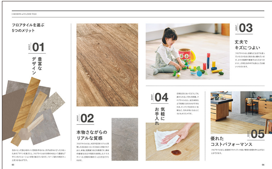
巻頭企画「フロアタイルを選ぶ5つのメリット」 フロアタイルの“モノ”としての魅力を説明

巻頭企画では、住宅空間にフロアタイルを「あえて」おすすめしたいポイントを、下記5つのメリットから紹介しています。 (1) 木目柄、石目柄、無地調、タイル調といった豊富なデザインバリエーション (2) 緻密な柄表現とエンボス加工による本物さながらの意匠性 (3) 丈夫でキズにつよい耐久性 (4) 気軽にお手入れができる機能性 (5) 優れたコストパフォーマンス—こうした住宅空間におすすめのポイントをピックアップし、コーディネートのコツや商品の特長を踏まえ、豊富な施工例写真と共に掲載しています。