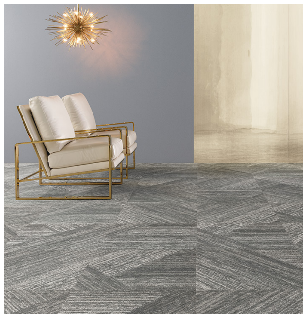
ジオグラフィック : DT-6202 広大な大地の起伏をダイナミックに表現した商品。