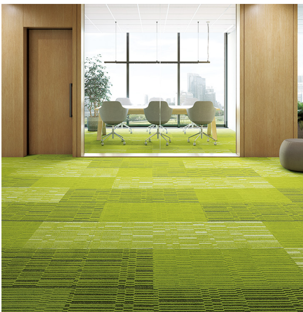
カラートランジション・モザイク F: DT-50603・50604・50605 デザインに高低差を設けたことで、模様濃淡が変化する。