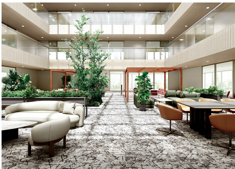
コーラルリーフ・パターン F：DT-78104

このうち「2023-2026 DT」は、当社のカーペットタイルの中でも、特に「意匠性と繊細な質感表現」にこだわったプレミアムコレクションです。空間を明るく演出するカラーやフレキシブルなレイアウトに役立つデザインバリエーションといった、オフィスの快適性や利便性に欠かせないポイントを押さえつつ、上質感のある“WELLNESS”な空間を実現します。さらに、テキスタイルデザイナーの氷室友里氏とのコラボレーションによる独創性と遊び心にあふれた商品や、サステナビリティにも配慮したデザイン性の高い商品を収録。ホスピタリティを重視したオープンスペースやエントランス、応接室といった、オフィス空間を象徴するこだわりのエリアやホテル、商業施設などに最適な55柄201点のラインアップです。