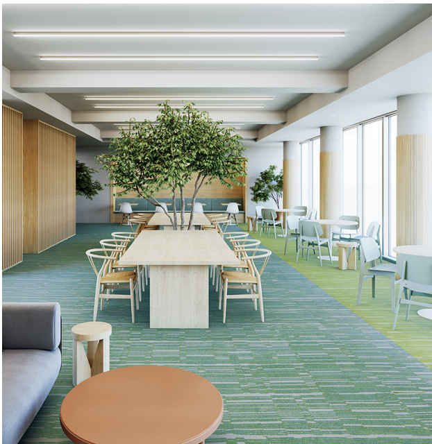
カラートランジション・パノラマ F: DT-50602 貼る方向を変えるだけで、色の見え方が異なるデザイン。