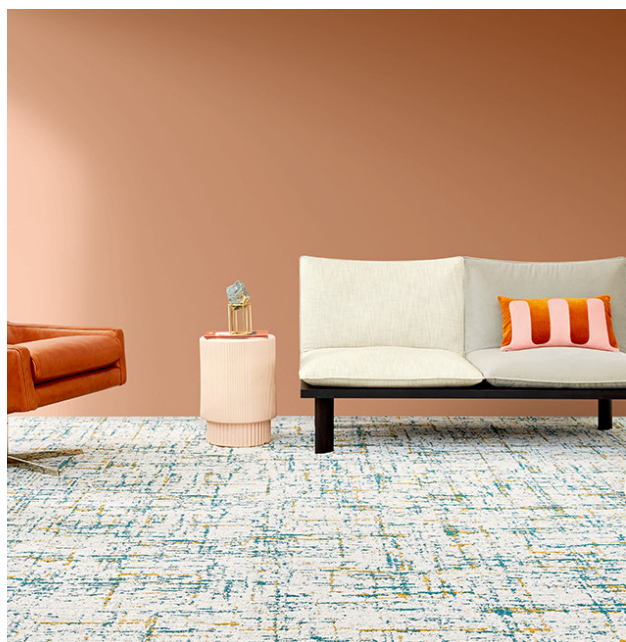
グリッドパスウェイ : DT-50803 パイル糸に「EcoSolution Q100 ナイロン」を使用。