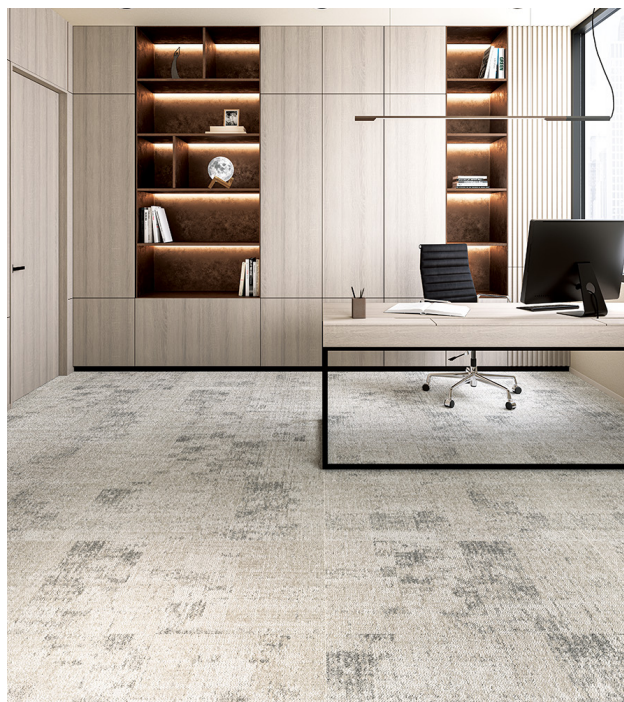
ムーンロード F : DT-78504 海面に伸びる月光をイメージした商品。