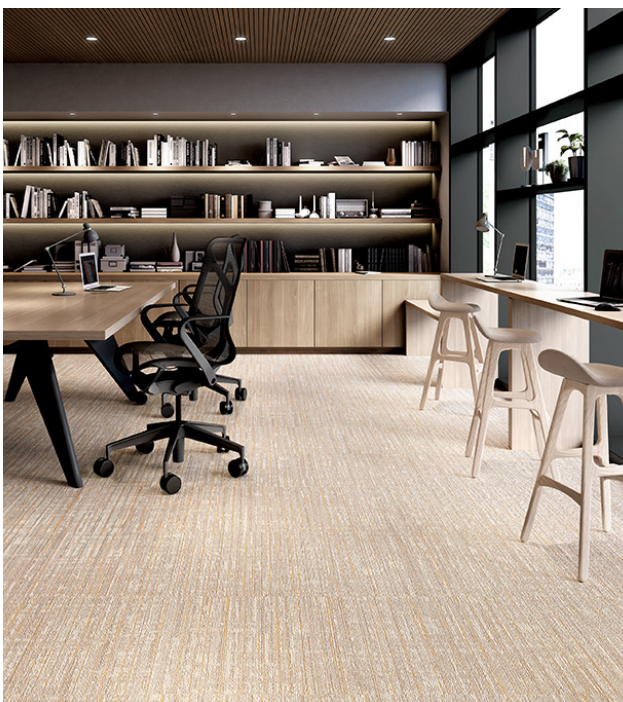
マニッシュツイード・リポーズ F : DT-76511 レジマールデザインのオフィス空間に最適な柔らかなカラー。