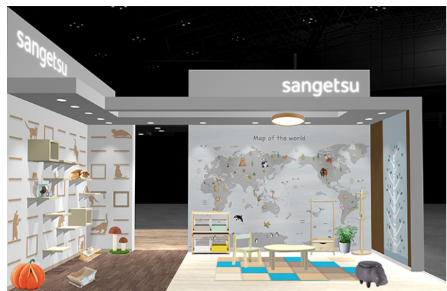
ブース外観イメージ（東3ホール JT-M08）

「JAPANTEX 2022」は、日本最大級の国際インテリア見本市であり、リアルでの開催は3年ぶりとなります。特別展示「デジタルプリントフォーラム」では、“インテリアを選ぶ、から、創るインテリアへ～エシカル&サステイナブル・インテリアに向けて～”をテーマとして、SDGs時代に即した環境に優しく新しいインテリアマーケットのあり方を提唱し、最新のデジタルプリントを駆使したトレンド商品を多数紹介します。