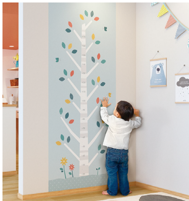
HZ-7503T ジョイフルツリー 身長計としてお子さまの成長記録もでき、暮らしが楽しくなるデザイン