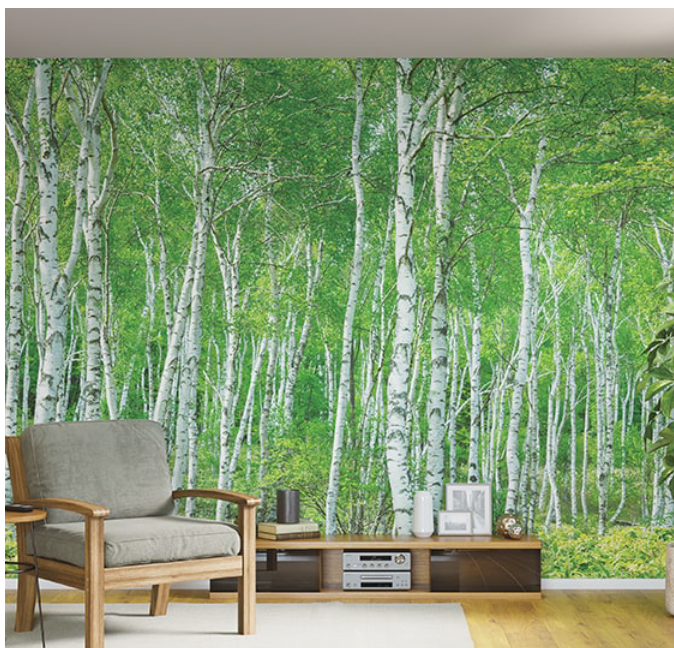
HZ-7001L おうち森林浴 大自然を感じ、心も体もリフレッシュ