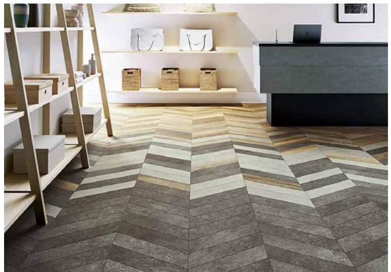
木目とモルタル調の異素材を組み合わせた 同一規格ならではの貼り分け提案