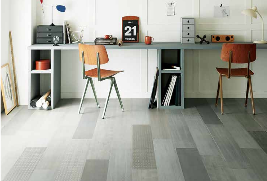
光の反射によって生まれる、今までにない多彩なデザイン 「ミスティカル」施工例：GT-853

ひと品番の中で異なるエンボスを組み合わせた「ミスティカル」などエンボスにこだわった商品を多数掲載。また、平行四辺形の規格の木目タイル「シェブロンウッド」と同一規格のモルタル調タイル「シェブロンストーン」など、従来にはなかったタイルの形・サイズならではの貼り分けのアイデアや、異素材ミックスによる新たなデザイン空間を提案します。