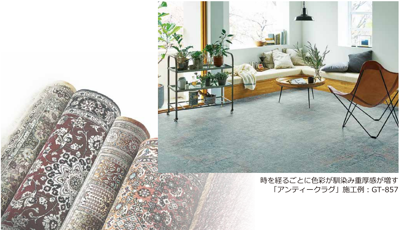
時を経るごとに色彩が馴染み重厚感が増す 「アンティークラグ」施工例：GT-857

「マテリアルラボ BETTER WITH AGE」では、自然や生活の中で生まれた表情全てを“味”として捉え、時代を越えた古いもの“エイジドマテリアル”に着目しました。ペルシャ絨毯から着想したアンティークラグや欧州のエイジングされたタイルを思わせるアンティークタイル、アメリカの古材を再現したアンティークウッド。3種類のプロアタイルでその魅力を表現しました。