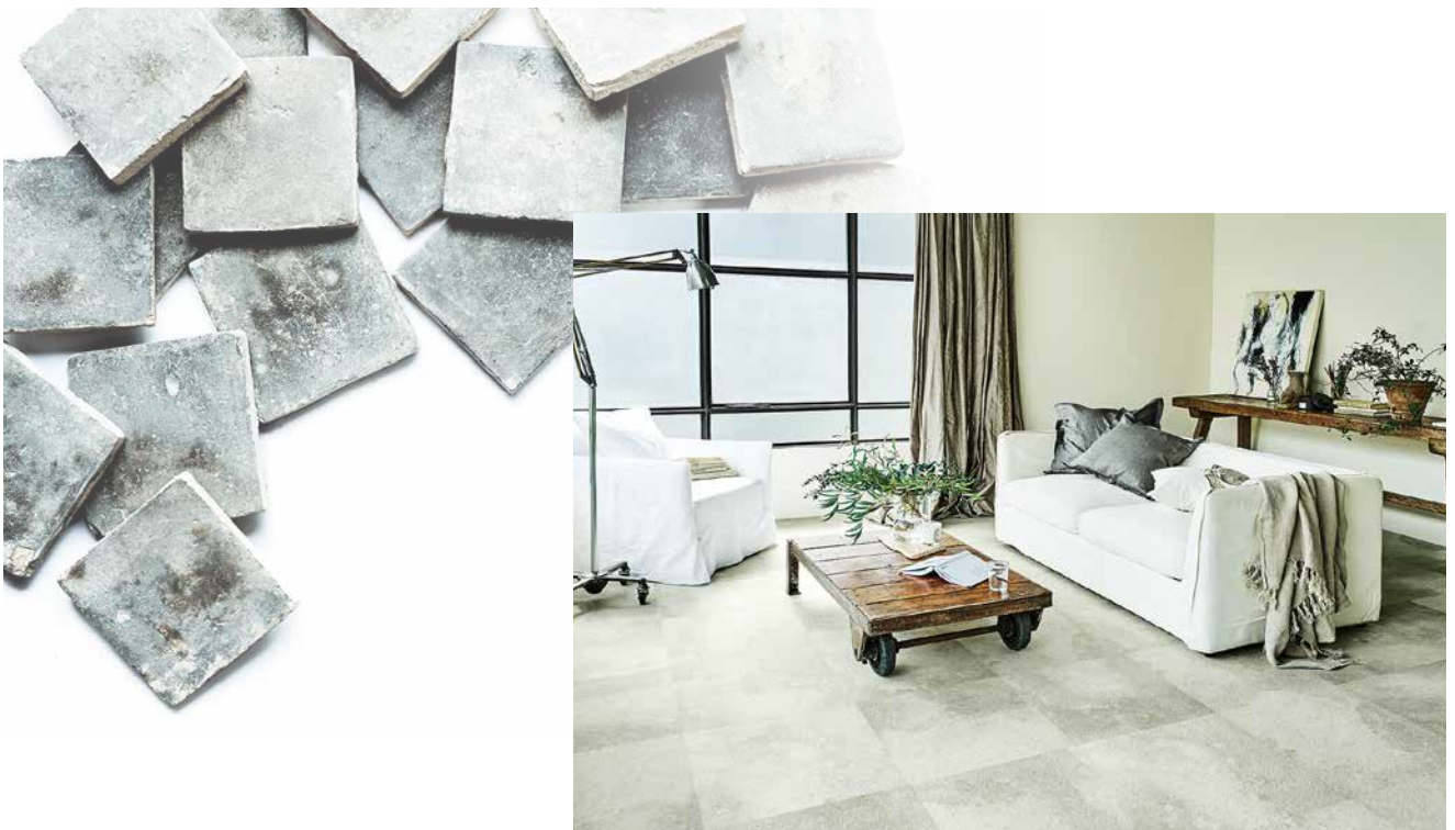
欧州では“古いものは美しい”がスタンダード 「アンティークタイル」施工例：IS-895