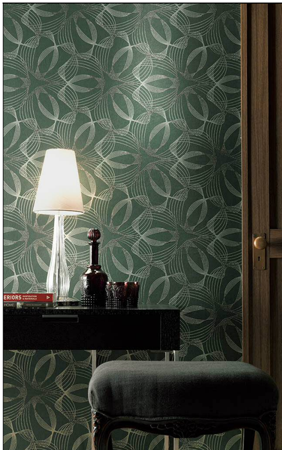
メタリックラインがモダンな SG-5780 の施工例

心を癒す優しい壁紙 「アート・イン・ホスピタル」シリーズ「鳥の歌」 SG-5741 の施工例