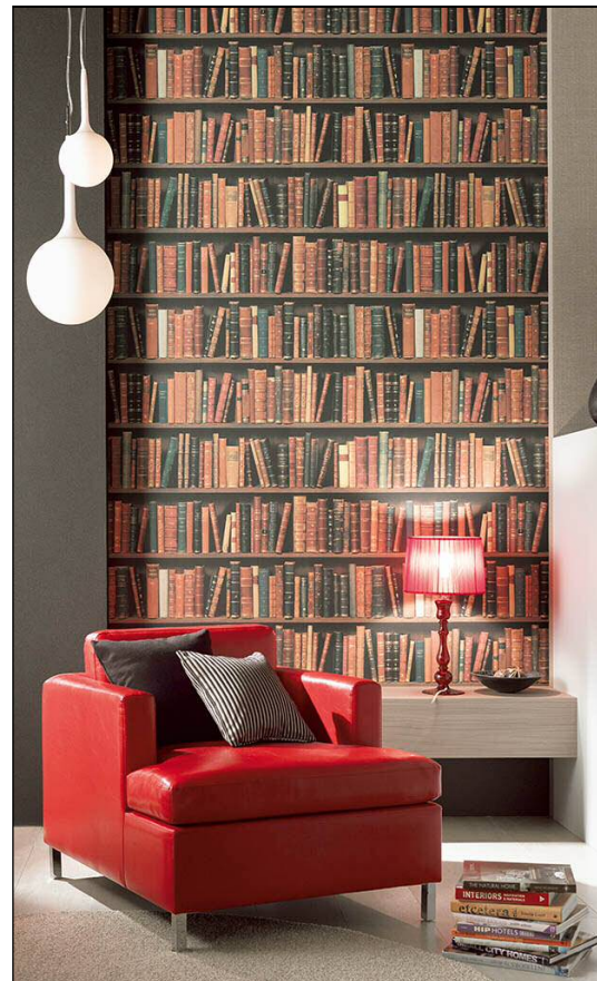
欧州のトレンド「トロンブレユ（だまし絵）」を 活用した、ワイドパターン SG-5946 の施工例