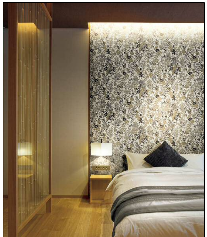
伊勢型紙「草花墨絵なぞり彫り」 SG-5075 の施工例