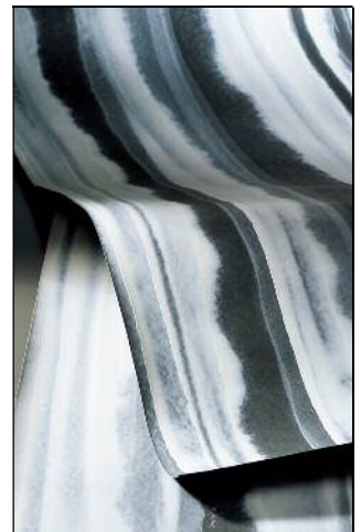
右：SG-5006 商品生地イメージ