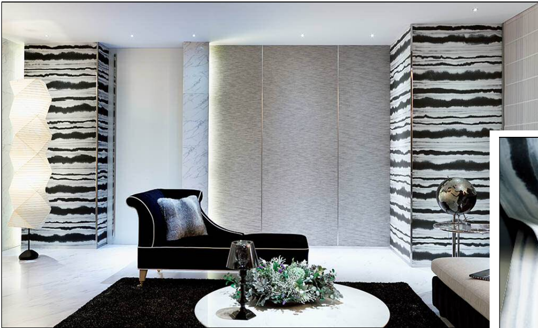
墨絵のような和紙の風合いが美しい SG-5006・SG-6278 の施工例