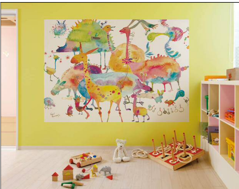
デジタルプリントシステム「ハイグラフィカ」 イージーオーダーシステムを活用した HY-0008 (Fantastic Zoo) の施工例