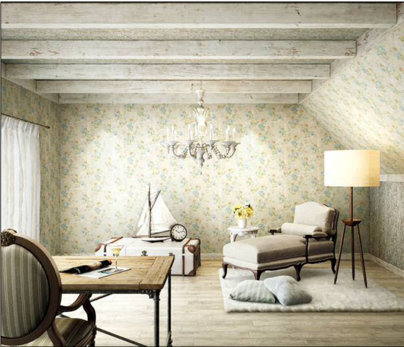
ナチュラルな植物柄がシャビーシックな 雰囲気を出し出すインポート壁紙 SG-6237・SG-6240 の施工例