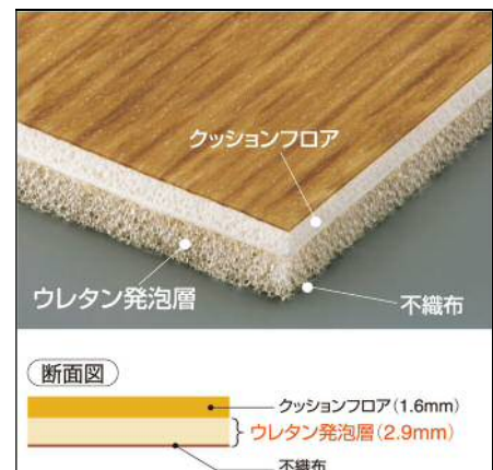
● 遮音フロアの構造画像と断面図

② 衝撃吸収性 : 4.5mm の製品の厚みが転倒時の衝撃を緩和。 住空間の安全性を高めます。