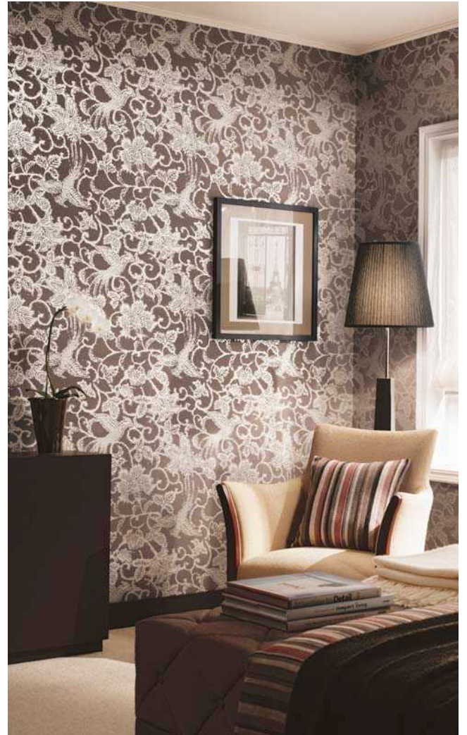
<右上>～鳳凰が入った大柄のデザインで 空間に高級感を与えるイギリス製の インポート壁紙 SG-427 のコーディネート例～