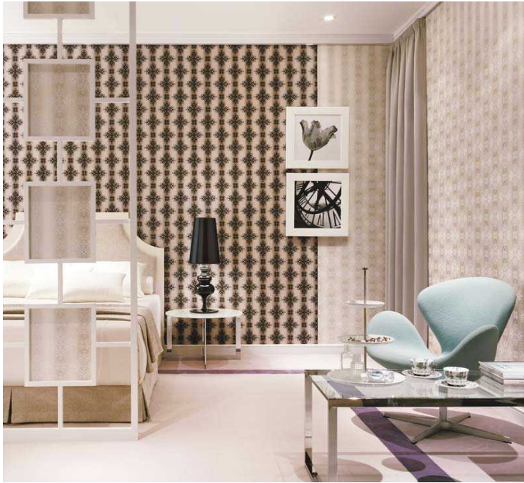
～高級感・立体感が特長で照明にも映える フロッキー壁紙 SG-313・SG-314 のコーディネート例～