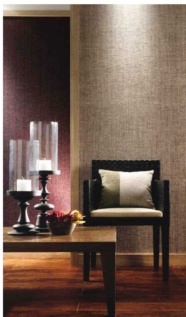
～ 紙布独特の自然な風合いで、 リラックス空間を創り出す紙布壁紙 SG-237・SG-238 のコーディネート例～