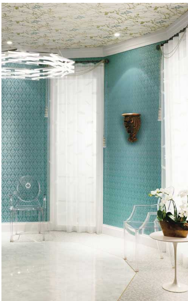
～ 鮮やかな色使いの織物壁紙 SG-25 と イギリス製のインポート壁紙(天井)SG-414 のコーディネート例～