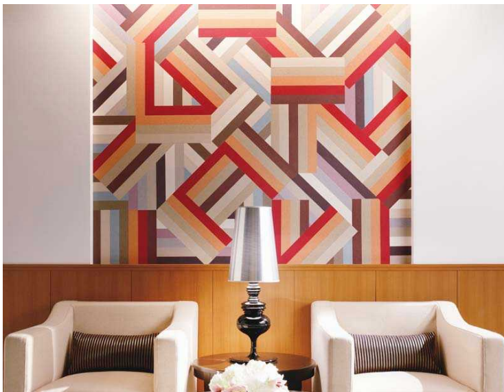
<左下>～大胆な色使いと大きなストライプが特長の インポート壁紙 SG-376・SG-378・SG-379 の デザイン貼りと、意匠性、表面強度に優れた 腰壁パネル SG-1613 のコーディネート例～