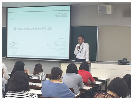
社員による環境講座（東京家政大学）

当社も、その趣旨に賛同し、環境プランニング学会と協働し、東海地区の環境配慮活動を促進できる人材の育成および活動のフィールドづくりを行っています。