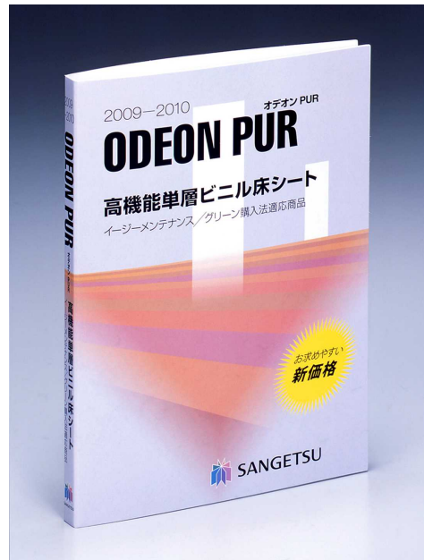
2009-2010 オデオン PUR