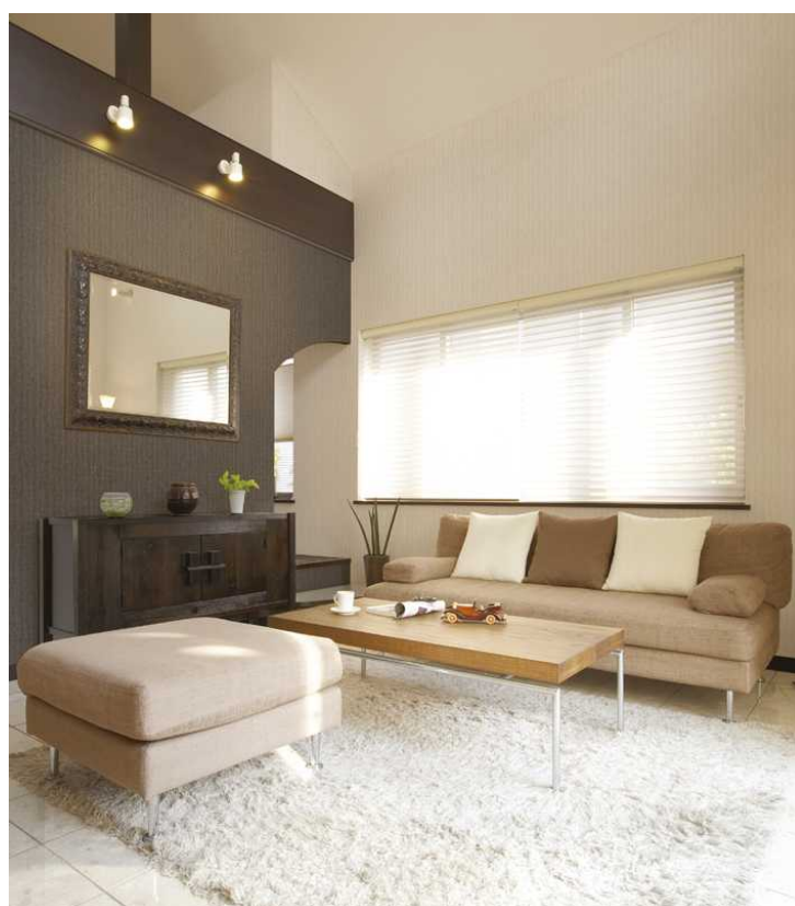
織物調 77-511 と 77-512 の「アクセントウォール」コーディネート例